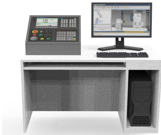
图 4 虚拟调试硬件平台原理示意图