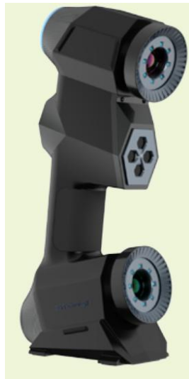
图 7 三维扫描仪示意图