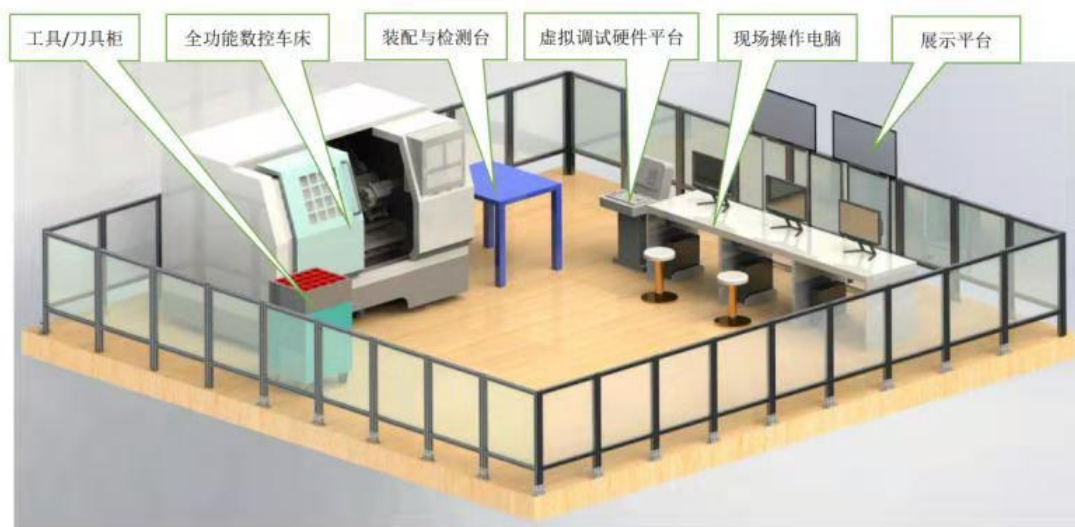
图 2 数控系统与工业软件应用技术平台布局图

数控技术与工业软件应用技术平台结构图如图 2 所示，包含全功能数控车、刀具工具柜、虚拟调试硬件平台、现场操作电脑、装配与检测台、展示平台等。