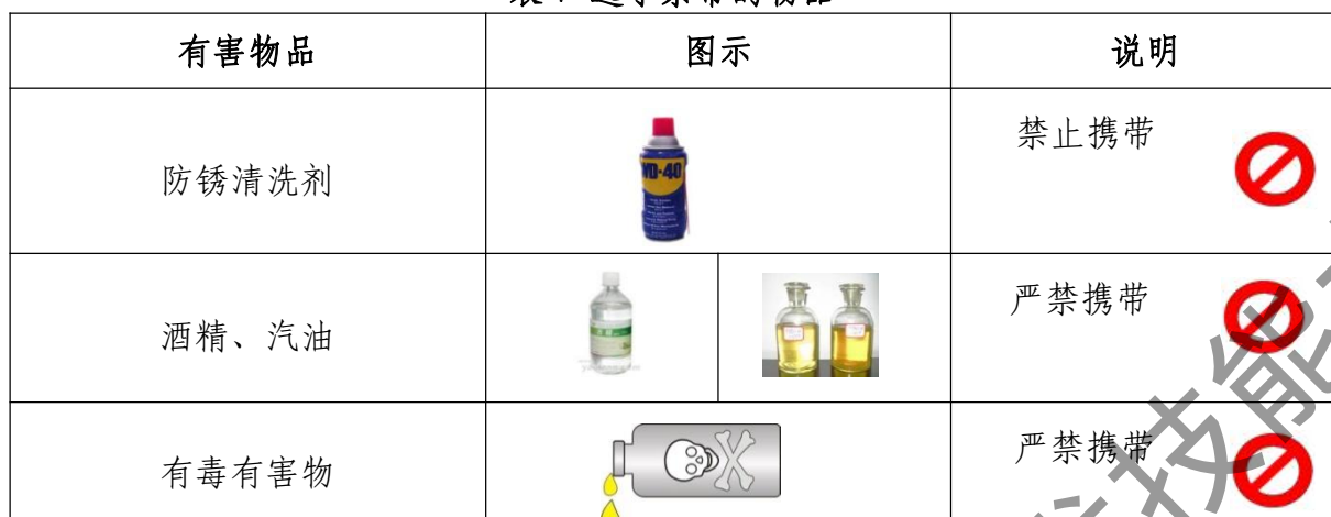
表 7 选手禁带的物品