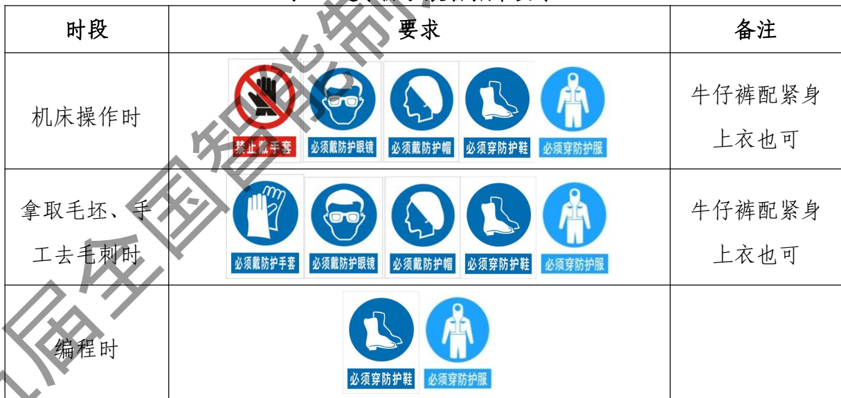
表 6 选手防护装备佩戴要求

大赛时，裁判员对违反安全与健康条例、违反操作规程的选手和现象将提出警告并进行纠正。不听警告，不进行纠正的参赛选手会受到不允许进入竞赛现场、罚去安全分、停止加工、取消竞赛资格等不同程度的惩罚。选手防护装备佩戴要求见表 6。