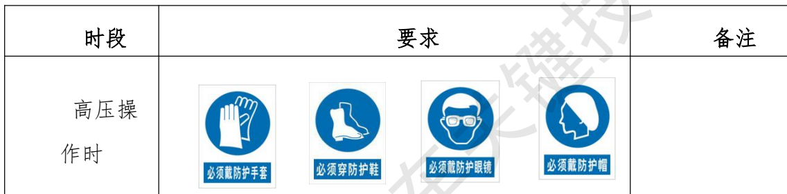
表10 选手防护装备佩戴要求

大赛时，裁判员对违反安全与健康条例、违反操作规程的选手将进行警告并纠正，不服从的参赛选手将受到不允许进入竞赛现场、处罚安全分、停止加工、取消竞赛资格等不同程度的惩罚。选手防护装备佩戴要求见表10。