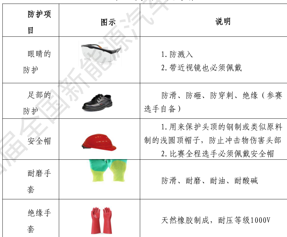
表9 选手安全防护装备