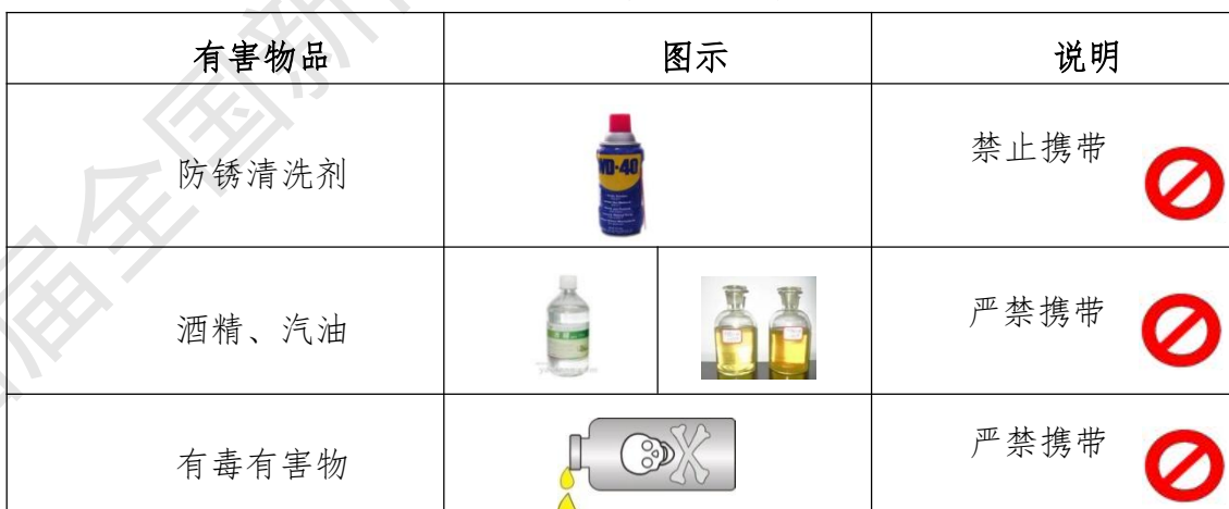
表11 选手禁带的物品

禁止选手携带的易燃易爆物品见表11。比赛期间产生的废料和切屑必须分类收集和回收。