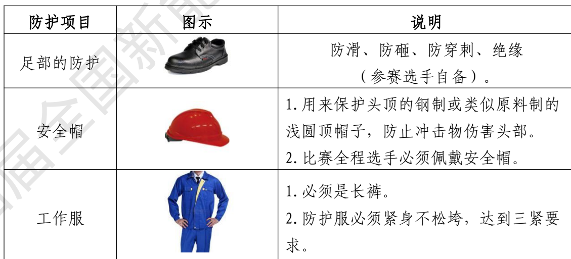
表 5 选手安全防护装备

大赛时，裁判员对违反安全与健康条例、违反操作规程的选手将进行警告并纠正，不服从的参赛选手将受到不允许进入竞赛现场、