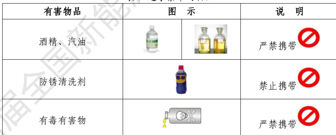
表 7 选手禁带的物品