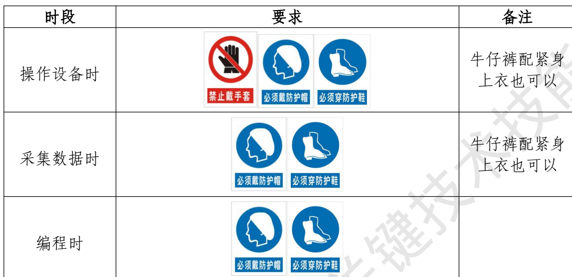
表 6 选手防护装备佩戴要求

处罚安全分、停止加工、取消竞赛资格等不同程度的惩罚。选手防护装备佩戴要求见表 6。