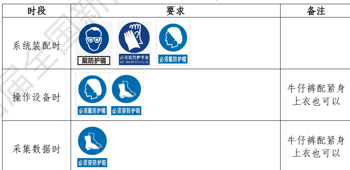
表7 选手防护装备佩戴要求

大赛时，裁判员对违反安全与健康条例、违反操作规程的选手将进行警告并纠正，不服从的参赛选手将受到不允许进入竞赛现场、处罚安全分、停止加工、取消竞赛资格等不同程度的惩罚。选手防护装备佩戴要求见表7。