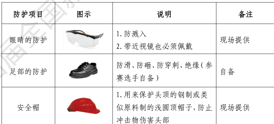
表 6 选手安全防护装备