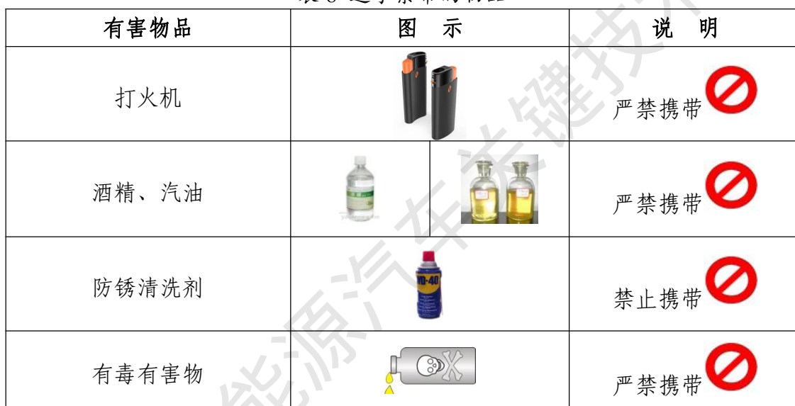
表 8 选手禁带的物品