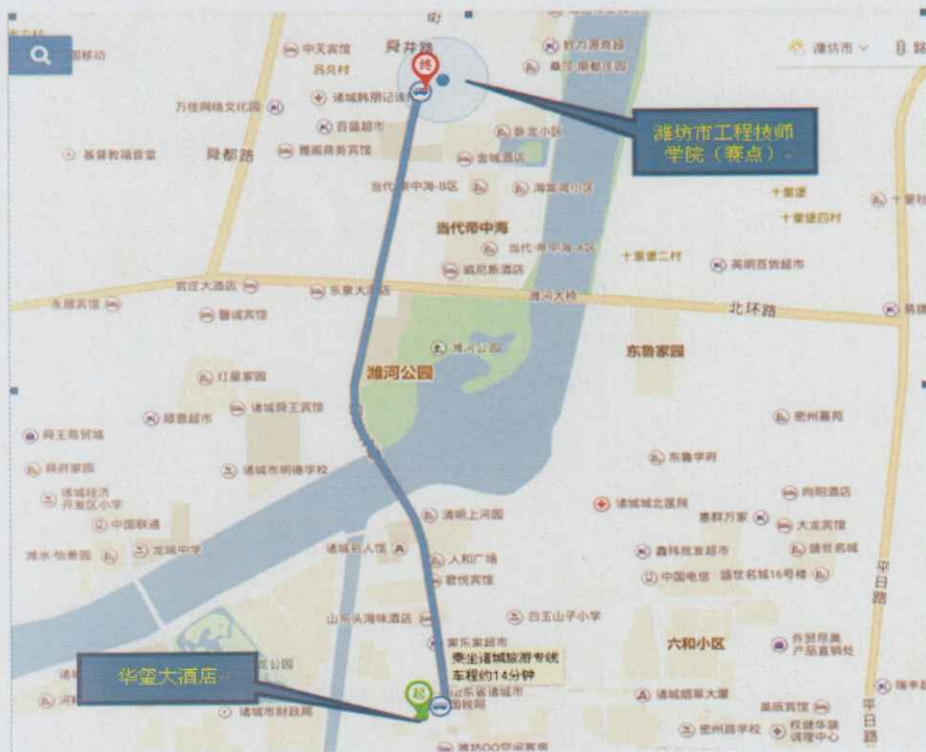
酒店到学校交通图

酒店到学校距离约 6 公里，公交线路：7 路、K002 路、11 路、旅游专线，乘坐出租车费用约 10 元，建议用滴滴出行打车软件。